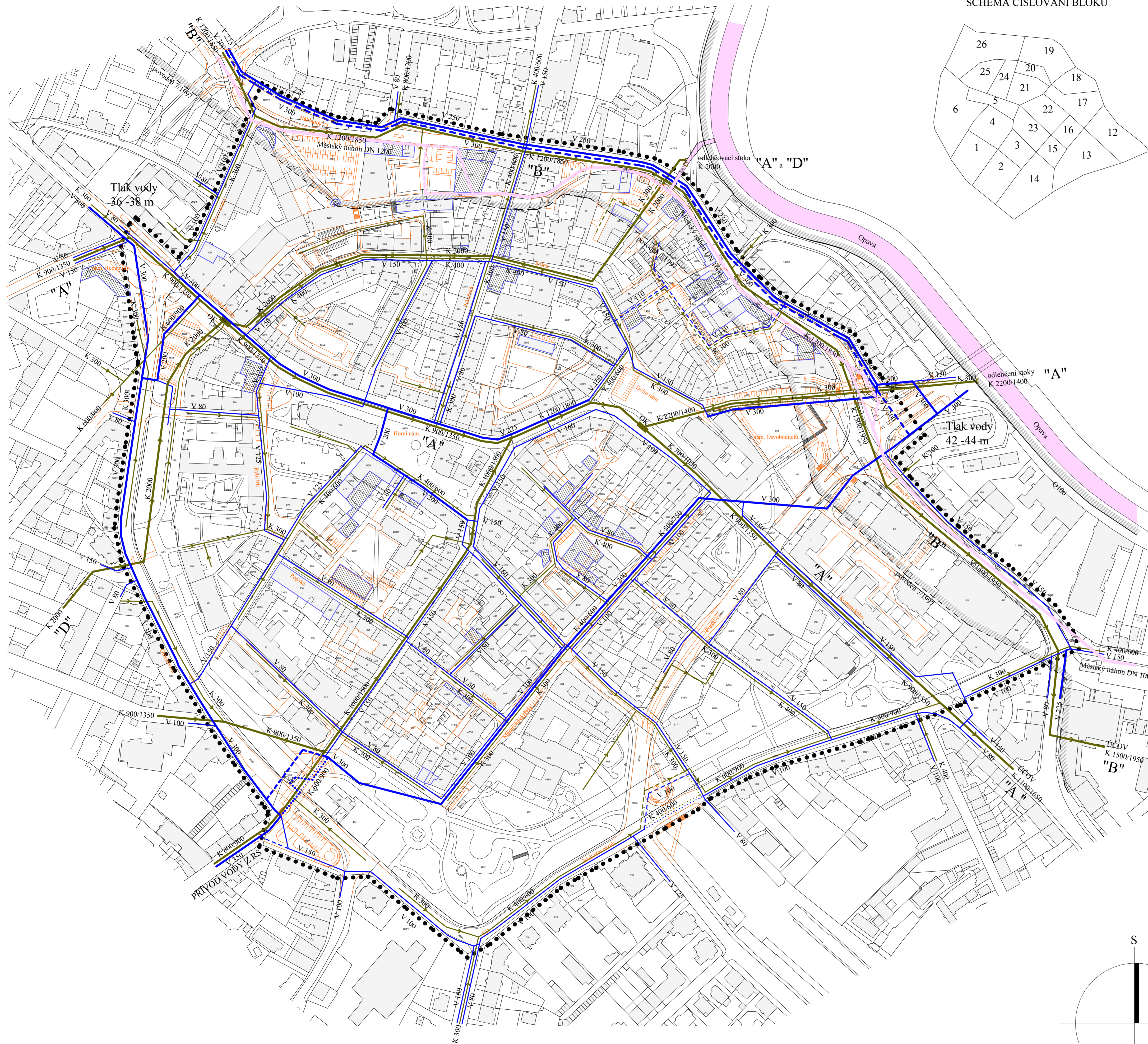
SCHEMA ČÍSLOVÁNÍ BLOKŮ